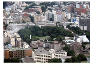
มหาวิทยาลัยเคโอ