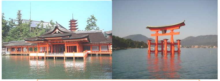
โทริอิของศาลเจ้าอัสึกุชิมะ ซึ่งเป็นศาลเจ้าลัทธิชินโต

จากการสำรวจพบว่าคนญี่ปุ่นร้อยละ 51.8 ระบุว่าตนไม่มีศาสนา ศาสนาในญี่ปุ่นถูกผสมผสานจนทำให้พิธีกรรมทางศาสนานั้นมีความหลากหลาย เช่นพ่อแม่พาลูกไปศาลเจ้าชินโตเพื่อทำพิธีซิจิ-โกะ-ซัน แต่งงานในโบสถ์คริสต์และฉลองในวันคริสต์มาส จัดงานศพแบบพุทธ และบูชาบรรพบุรุษแบบขงจื้อ นอกจากนี้ ตั้งแต่ต้นพุทธศตวรรษที่ 25 มีลัทธิต่าง ๆ เกิดขึ้นมากมายเช่นลัทธิเทนริเกียว และลัทธิโอมชินริเกียว