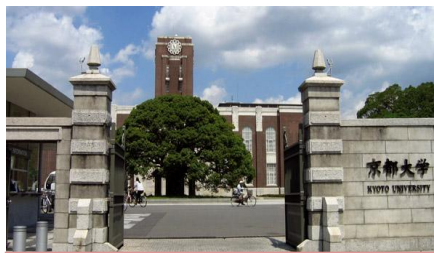
มหาวิทยาลัยเคียวโตะ