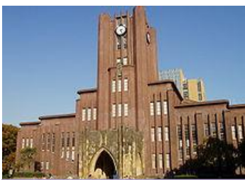
มหาวิทยาลัยแห่งโตเกียว

ระบบการศึกษาในระดับประถม มัธยม และอุดมศึกษาถูกนำมาใช้ตั้งแต่ พ.ศ. 2451 ซึ่งเป็นผลจากการปฏิรูปเมจิ ตั้งแต่ พ.ศ. 2490 การศึกษาภาคบังคับของญี่ปุ่นมีระยะเวลา 9 ปี ตั้งแต่ประถมศึกษาจนจบมัธยมศึกษาตอนต้น ซึ่งเกือบทั้งหมดจะเรียนมัธยมศึกษาตอนปลายต่อ จากข้อมูลของกระทรวงการศึกษาของญี่ปุ่น (MEXT) ใน พ.ศ. 2547 พบว่าร้อยละ 75.9 ของผู้จบการศึกษาระดับมัธยมศึกษาตอนปลายจะเรียนต่อในมหาวิทยาลัย วิทยาลัย หรือสถาบันอุดมศึกษาอื่น ๆ การศึกษาในญี่ปุ่นเต็มไปด้วยการแข่งขันโดยเฉพาะอย่างยิ่งการสอบเข้าเพื่อเรียนต่อในมหาวิทยาลัย โครงการประเมินผลการศึกษานานาชาติ (Programme for International Student Assessment: PISA) ซึ่งจัดขึ้นโดย โออีซีดี จัดอันดับให้เด็กญี่ปุ่นมีความรู้และทักษะเป็นอันดับ 6 ของโลก มหาวิทยาลัยที่มีชื่อเสียงในญี่ปุ่น เช่น มหาวิทยาลัยโตเกียว มหาวิทยาลัยเคโอ และมหาวิทยาลัยเคียวโตะ เป็นต้น